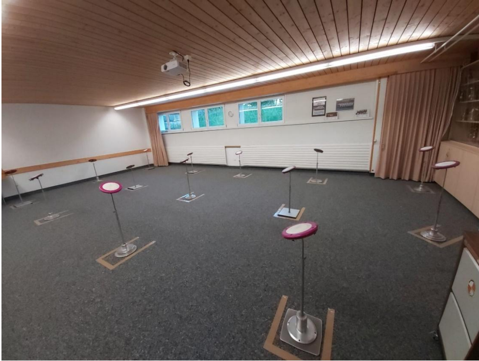
Local de répétition avec marquage au sol

Schweizerischer Tambouren- und Pfeiferverband Association Suisse des Tambours et Fifres Associazione Svizzera dei Tamburini e Pifferi