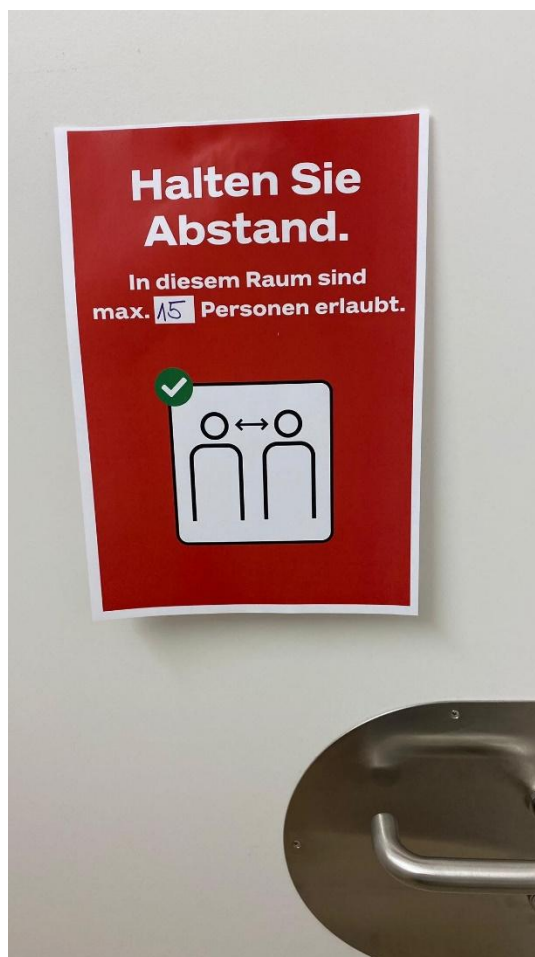
Occupation maximale de l'espace