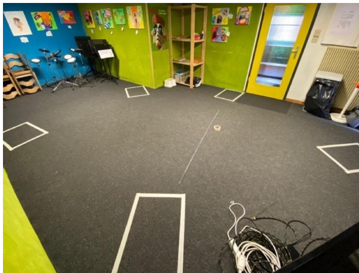
Local de répétition avec marquage au sol (distance 1.5 m et avec le port du masque)